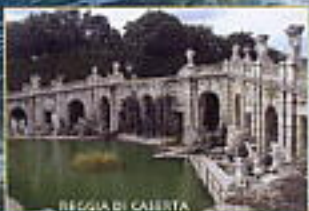
REGGIA DI CASERTA