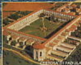
COSTIERA DI PADULA