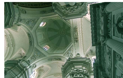
Cattedrale di San Paolo di Aversa