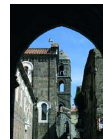
Madonna col Bambino