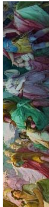
Affresco nella Reggia di Caserta

eventi aprile _Mostra-mercato del verde Caserta (III fine settimana)