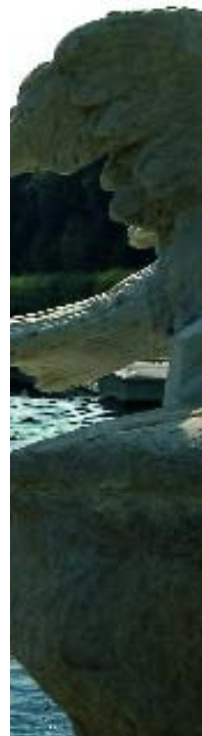
Reggia di Caserta

È proprio questa l'area che gli antichi chiamarono Campania felix , per la posizione privilegiata e la fertilità del suolo. Irrigata dal Volturno e favorita dal clima mite, la provincia si stende dal mare ai rilievi degli Appennini, alternando una rigogliosa vegetazione a luoghi di grande interesse storico e culturale.