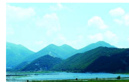
Parco Regionale del Taburno