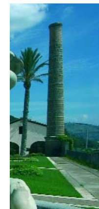
Interno della Reggia di Caserta