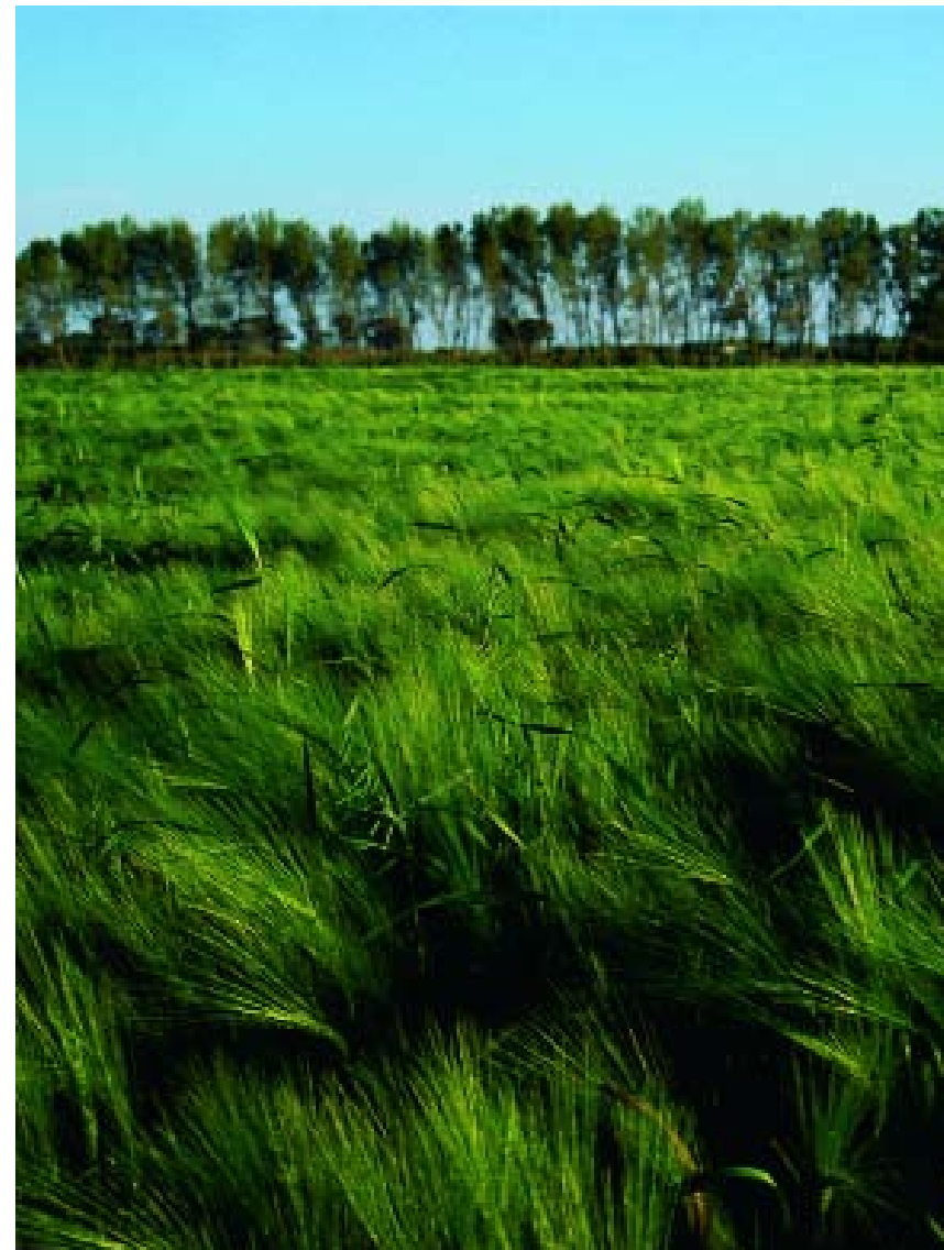
Il litorale domizio