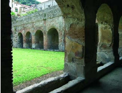
Villa Romana di Minori

comunale. Con la sua lunghissima spiaggia e il bel lungomare, Maiori vanta il patrimonio turistico-alberghiero più notevole della zona. Ruderì di castelli e torri testimoniano il suo splendore nel Medioevo, quando era circondata e difesa da mura e fortificazioni. Domina l'abitato la chiesa di Santa Maria a Mare : il 15 agosto qui si commemora con festeggiamenti un evento del 1204, quando dei marinai ripescarono una statua della Vergine che una nave proveniente da Costantinopoli, rifugiata per una tempesta a Maiori, era stata costretta a gettare in mare. Sul'altare maggiore una scultura lignea del '400 raffigura la Madonna col Bambino; una raccolta di opere d'arte è custodita nel Museo della Sacrestia e nella cripta sottostante. Di origine medievale è il popolare santuario dedicato alla Madonna delle Grazie , ricostruito nel '700. Da vedere l'inusuale complesso rupestre di Santa Maria de Olearia , una badia benedettina edificata nel mille. Negli edifici aggrappati alle rocce, in una delle grotte naturali della zona, si aprono sale, cappelle, piccoli portici affrescati. Con una gita in barca si possono visitare la Grotta Sulfurea e la Grotta Pandora . La prima è ricca di acqua sulfureo-magnesica con proprietà curative; nella seconda, lo scenario verde smeraldo, le stalattiti e stalagmiti creano uno scenario indimenticabile. Molte testimonianze del passato anche nei dintorni di Minori , graziosa località balneare, come una grande villa rustica.