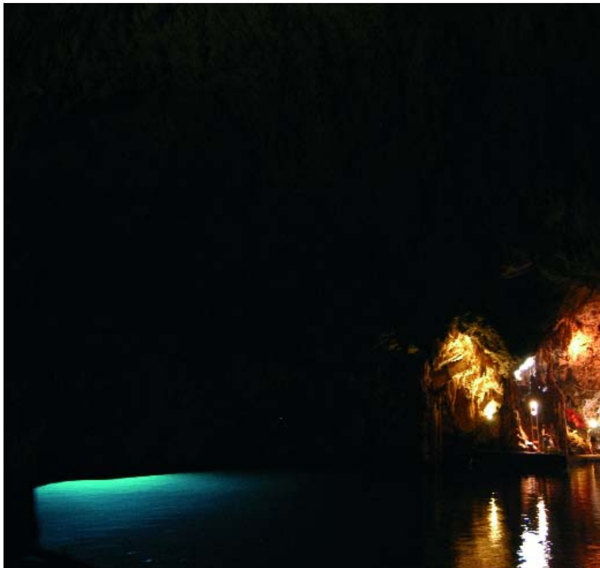
Grotta dello Smeraldo

La Grotta dei Santi è raggiungibile dalla strada statale. Qui sono visibili i ruderi dell'antico monastero benedettino dei Santi Quirico e Giulitta, fondato nel 986. La piccola grotta è decorata con affreschi in stile bizantino risalente al XII secolo.