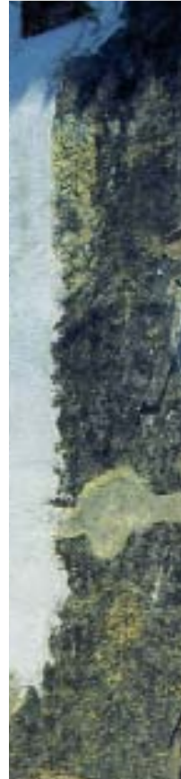
Veduta dalla Costiera Amalfitana