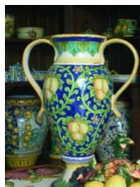
Ceramiche di Vietri

entrare nelle fabbriche, lasciare che in quel turbinio di idee e di colori qualcosa colpisca la fantasia. La scelta è quasi infinita e ogni bottega si distingue per stile e scelta di decori.