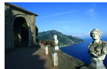
Duomo di Ravello